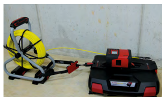
RM35 mit Montageplatte-Systemkoffer, Glasfasereinziehsystem Ø 4,5 mm