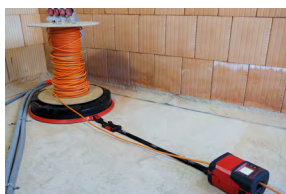
RM35 mit Gurt und Clip-System an XB 500 befestigt